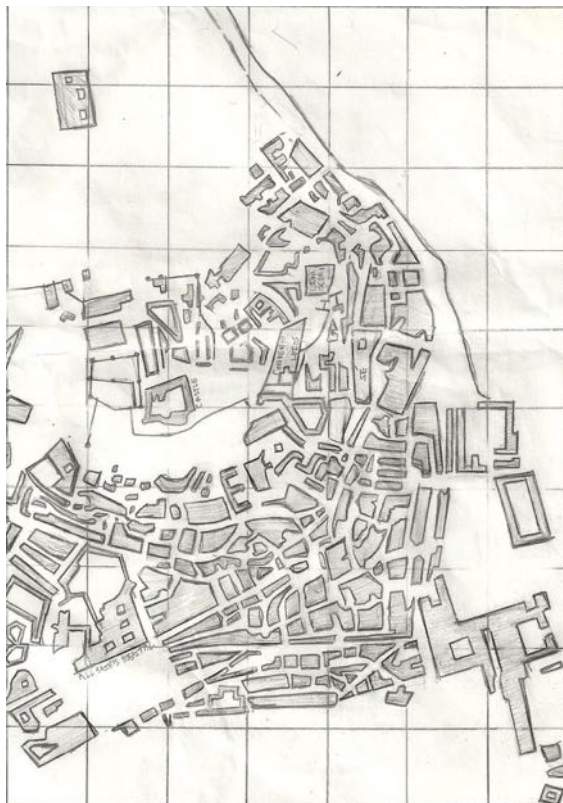
Desenho de Richard Zimler a propósito dos passos de Berequias Zarco por Lisboa. Grafite sobre papel, 1991.