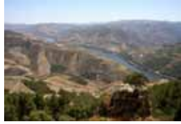
Figura 12 – O miradouro de S. Leonardo de Galafura

Mas a poesia de MVC retrata outras paisagens que resultam do seu forte apego à terra, à natureza domesticada pelas práticas agrícolas, ao ager . Na poesia de MVC, a terra é cantada como berço fecundo e fecundante, sempre procurado nas suas visitas frequentes a Cerva, a sua terra natal. Nas paisagens de Cerva, que descreve como “um vale fundeiro a oeste da serra do Alvão”, era transportado para a infância, como canta em poemas lindíssimos, como “Terra Minha” em que confessa em preâmbulo “ Esta é a ditosa pátria, minha amada ” (do Vaz...de Carvalho):