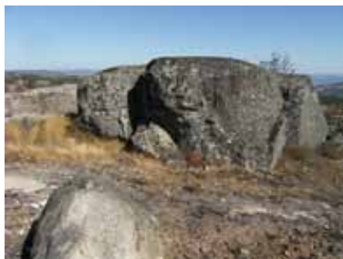
Figura 9 – Blocos graníticos da Serra do Alvão

“Alvorada de Amor”, in Poemas do Solstício , p. 40