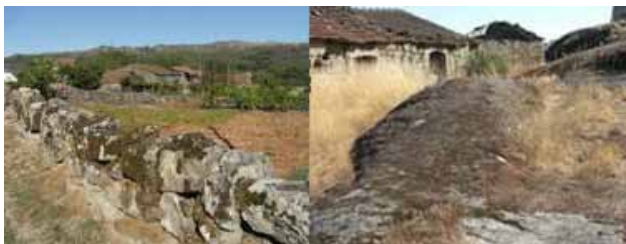
Figura 10 – Lamas de Olo (Serra do Alvão)

“Terra Feita” , in Poemas do Solstício , p.24