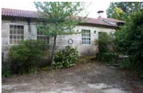
Figura 13 – Fachada principal da casa agrícola de Quintela (Cerva)

MVC descreve também paisagens urbanas, na condição de serem lugares de vivência e de afetos. Nesta categoria tem destaque a sua casa, no lugar da Timpeira, que localiza, de forma cartográfica, no preâmbulo do poema “Sinos de São Dinis” ( in Poemas do Solstício , 101): “Moro no Alto das Cruzes, um cômodo que faz testada ao vale do Rio Corgo, que abre no lugar da Ínsua, coleando o Cemitério de São Dinis, prossegue torcicolando Vila Real, passa o lugar das Lavadeiras, inflectindo depois para norte, em ângulo à esquerda, até ao lugar do Boco” .