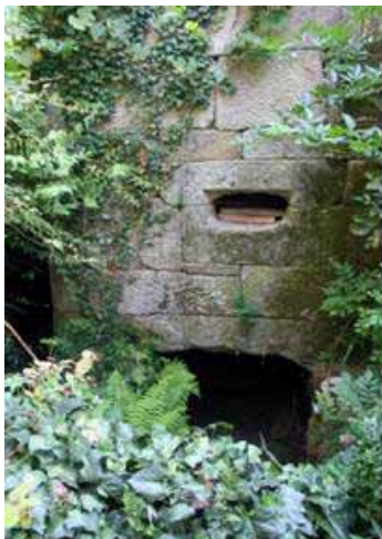
Figura 15 – Moinho de água (Casal de Pombeiro, Cerva)

Na obra poética de MVC reconhece-se igualmente um pontuar dos ciclos naturais e das actividades campestres ao longo do ano, um registo das horas do dia, um percorrer constante de paisagens e ambiências rurais, universos reais e emocionais, como provam os versos: