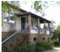
Figura 14 – Fachada principal da casa da Timpeira (Vila Real)

Na sua obra surgem outras, poucas, referências a lugares urbanos, com destaque para o poema de homenagem ao pelourinho, escrito quando da sua restituição ao largo onde inicialmente fora colocado (“O Pelourinho”, in Visão Alvânica ). Este poema faz parte do capítulo “O meu Tugúrio”, o seu escritório, no Largo do Pelourinho, em Vila Real, que contém um conjunto de poemas em que MVC ironiza e esconjura a sua profissão de advogado: “Carvalho & Companhia”, “Profissão sem Fé”, “A minha Toga Rota”, “Chatos, chatos & Companhia” ( in Visão Alvânica ). A paisagem urbana surge também no poema de despedida da cidade de Coimbra, onde MVC estudou, que diz ter deixado sem saudade: