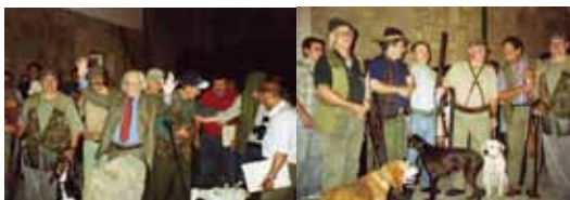
Figura 2 – MVC com amigos no lançamento do livro Poemas do Solstício e entre caçadores

MVC detinha uma personalidade inquieta, simultaneamente simples e complexa, que tanto precisava do isolamento, o qual encontrava nos passeios e caçadas na serra, como gostava de conviver com amigos, mas em ambas situações, percebe-se que a autenticidade foi sempre um traço relevante do seu carácter. Essa dimensão espelha-se também no plano da socialização em que MVC era totalmente eclético, tanto lhe dava prazer o convívio com as gentes da terra, pastores, caçadores, carteiros, agricultores, como cultivava o debate intelectual em tertúlias com os amigos e os colegas, até de madrugada, alguns dos quais lembrados em poemas integrados no capítulo “Homenagens”, do livro Poemas do Afélio .