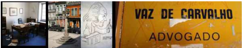
Figura 3 – O advogado Manuel Vaz de Carvalho

“Profissão sem Fé”, in Visão Alvânica , p.78