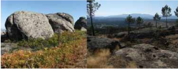
Figura 11 – Paisagens da Serra do Alvão

“Leão Solitário”, in Poemas do Afélio , p. 24