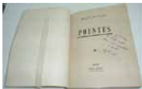
Figura 6 – Os afectos de Manuel Vaz de Carvalho (I) ( Poentes , 1941 – com dedicatória ao Dr. Pinto Soares)

No domínio dos afectos, toda a obra de MVC prova que o poeta foi um homem de fortes paixões e grandes amizades. Quando da morte da sua mãe, tinha então 19 anos, MVC dedica-lhe um livro de poemas líricos para o qual escolheu mais um nome associado à geografia – Poentes (Fig. 6).